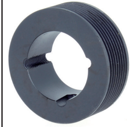
POULIES PPL à moyeu amovible PPL MA x D x nb gorges G